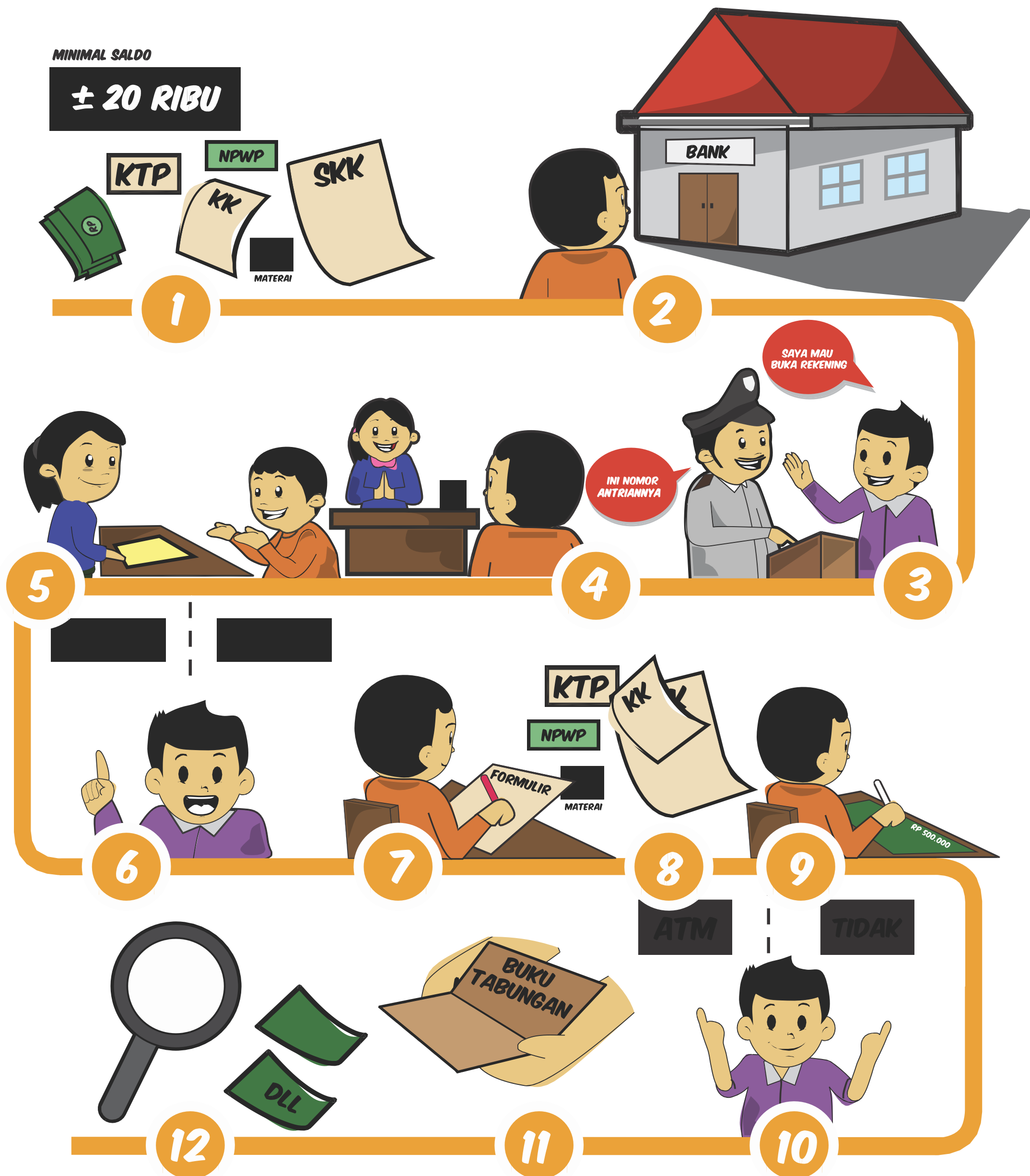
Tahapan membuka rekening di Bank